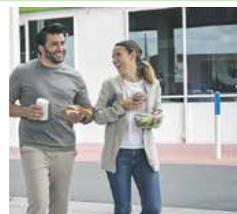
Lange Fahrt im Auto? Viele Menschen unterbrechen diese gern für eine Pause mit Kaffee und Snacks.

ist der Cappuccino, gefolgt von Café Crema und Latte Macchiato. An rund 2.400 Aral-Tankstellen in Deutschland gibt es seit Kurzem zudem den Café Intense, einen Wachmacher mit hohem Koffeingehalt. Wie alle anderen repräsentativen Online-Befragungen im i:omnibus von Ipsos Observer wurden 1.100 Menschen im Alter von 18 bis 75 Jahren befragt. Besonders beliebt unterwegs