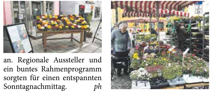
an. Regionale Aussteller und ein buntes Rahmenprogramm sorgten für einen entspannten Sonntagnachmittag. ph