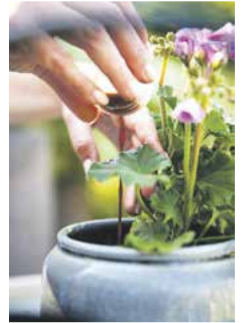
Immer richtig dosiert. Fertigdünger machen es nicht nur Pflanzen-Einsteigern einfach, das Grün zu versorgen.

finden sich mehr Tipps für Pflanzenfreunde und die, die es noch werden wollen.