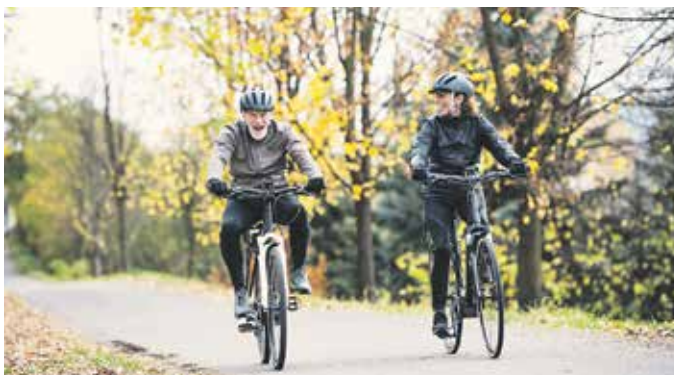
Fit auf dem Weg zur Arbeit: Wer das Fahrrad zum Pendeln nutzt, kann ein tägliches Sportpensum ganz einfach in den Alltag integrieren.

werden, desto länger sitzen die Menschen, oft stundenlang und ohne Ausgleich. Bewegungsmangel wirkt sich jedoch spürbar auf Gesundheit, Wohlbefinden und Leistungsfähigkeit aus. Die Weltgesundheitsorganisation (WHO) stuft körperliche Inaktivität als einen der wichtigsten Risikofaktoren ein und sieht darin eine wesentliche Ursache für zahlreiche Krankheiten wie Übergewicht, Herz-Kreislauf-Probleme, Diabetes Typ 2, bestimmte Krebsarten sowie Beschwerden des Muskel- und Skelettsystems. Kleine Veränderungen können schon große Wirkung entfalten, etwa regelmäßiges Radfahren.