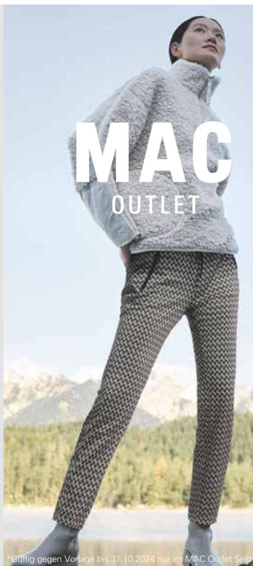
*Gültig gegen Vorlage bis 31.10.2024 nur im MAC Outlet Selb

Am Sonntag, 3. November , um 17.00 Uhr, geben die Theatergastspiele Fürth die Kriminalkomödie „Pater Brown und der Tod des Schneewittchens“, ein Stück um einen verwirrten Landstreicher, der bald als der gesuchte Ebenholz-Händler Michael Snow identifiziert wird, der seine Frau und seine Tochter umgebracht haben soll. Beide gelten als vermisst und spannend ist der Untertitel „Fair Play Tour“ des diesjährigen Irish Folk Festivals, das