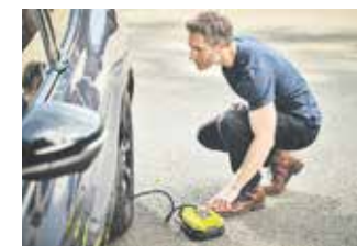
Der richtige Reifendruck ist bei schwierigen Straßenverhältnissen besonders wichtig.

Akkus des One+-Systems von Ryobi mit Lithium-Ionen-Technik in über 200 Geräte – mehr unter de.ryobitools.eu. Neben der Sauberkeit dient die winterliche Autopflege auch der Sicherheit: Auf klare Scheiben und den richtigen Reifendruck achten!